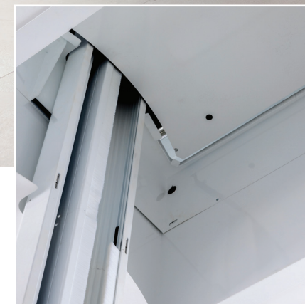
Rails autoportants avec système de câbles non apparents