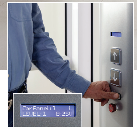
Fonctionnement simple et intuitif avec panneau à cristaux liquides d'état du Luma à l'intérieur de la cabine