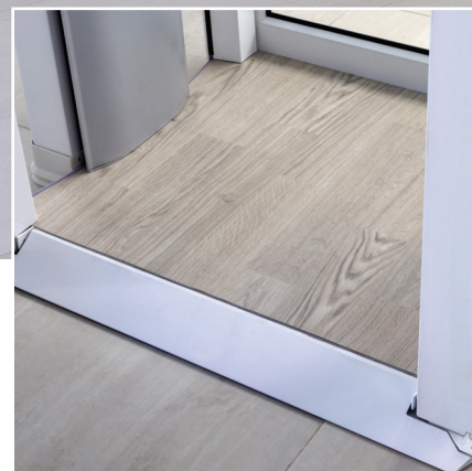
Seuil incliné et revêtement de plancher antidérapant attrayant