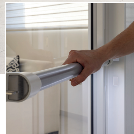
Main courante et panneaux acryliques pleine hauteur